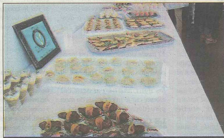
Le buffet tel qu'il se présentait une fois le marathon réalisé

17 h 15, le compte à rebours commence : « Vous n'avez plus que 15 mn ! ». Deux tables mettent le turbo, les quatre autres ont terminé et font même la vaisselle ! 17 h 30, mains en l'air ! Je passe en revue et goûte les petites merveilles, dignes des plus grands traiteurs. Finalement, la table 6 remporte la victoire et un cadeau pour chacun de ses 9 champions. « La cuisine n'a pas pour seule vocation d'initier au goût et à la qualité des plats de notre patrimoine. C'est un art qui fédère et rassemble amateurs et passionnés. Mais surtout c'est un dépassement de soi-même à la portée de tout le monde ! », me dit Yanick Poncel. Bien analysé.